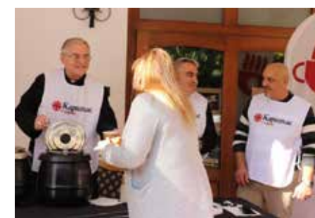
Ден на Каритас в енория „Успение Богородично“