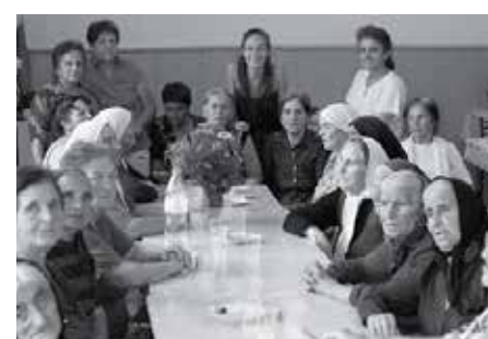
Дневен център „Св. Василий Велики“ в Пловдив