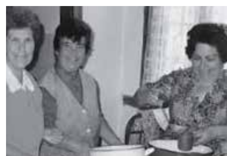
Социална кухня в Малко Търново