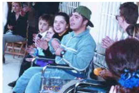
Откриване на Център „Благовещение“ в София