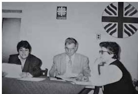
Управителен съвет на Каритас София