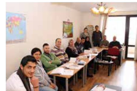
Интеграционен център „Св. Анна“ в София