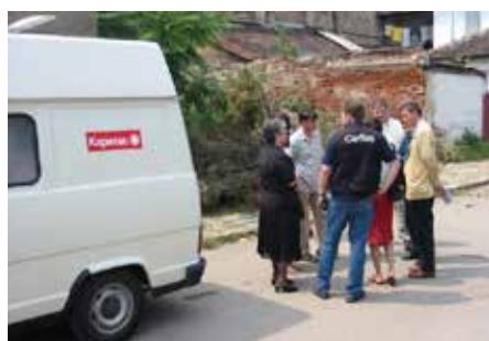
Посещение на терен с партньори от Австрия и Франция в София