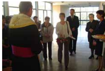
Откриване на Център за домашни грижи в Малко Търново