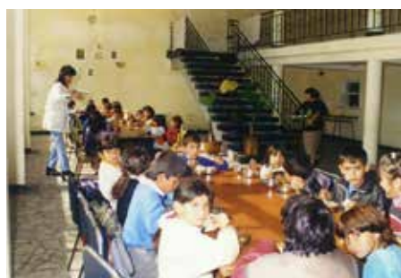
Подкрепа за децата, които редовно посещават училище от с. Баня, общ. Нова Загора